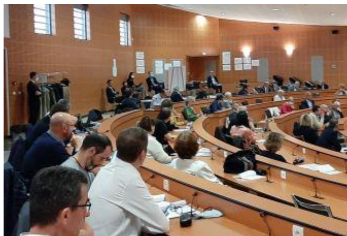
Membres de la CRSA de BFC lors du Ségur de la santé le 17 juin 2020